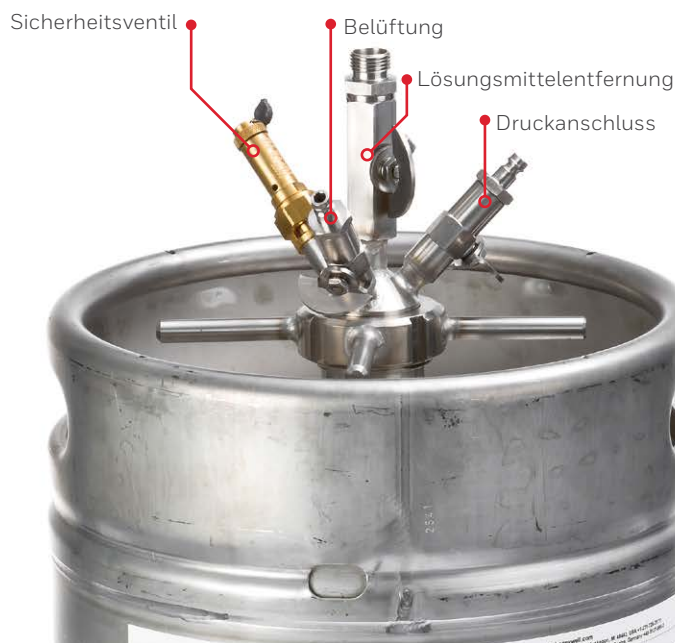
Dosierkopf für Fässer mit integriertem Tauchrohr